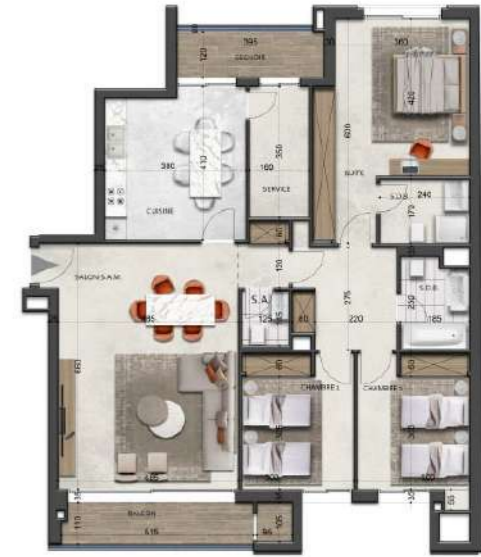
S+3-type-6 178.64 m 2