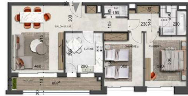
S+2-type-5 112.29 m 2