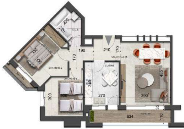
S+2-type-1 98.39m 2