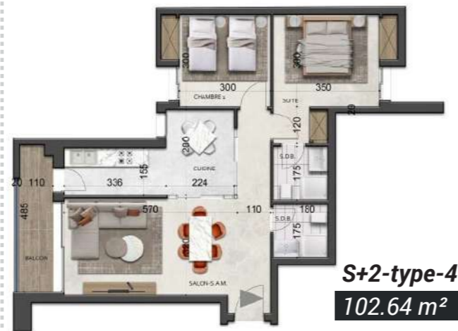
S+2-type-4 102.64 m 2