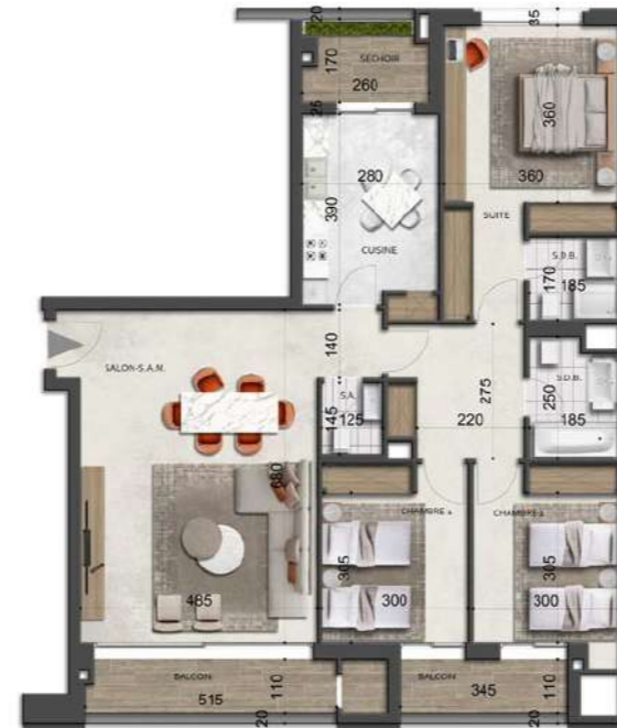
S+3-type-7 166.89 m 2