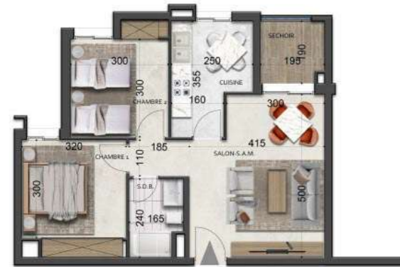
S+2-type-3 82.07 m 2