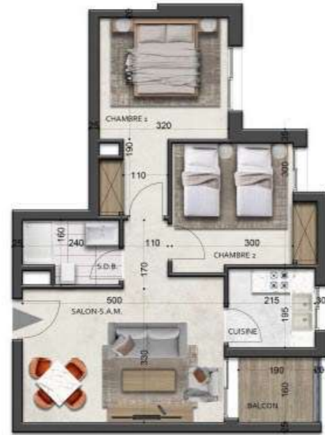
S+2-type-2 74.51m 2