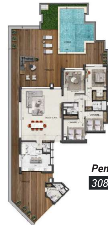
Penthouse-type-8 308.52 m 2